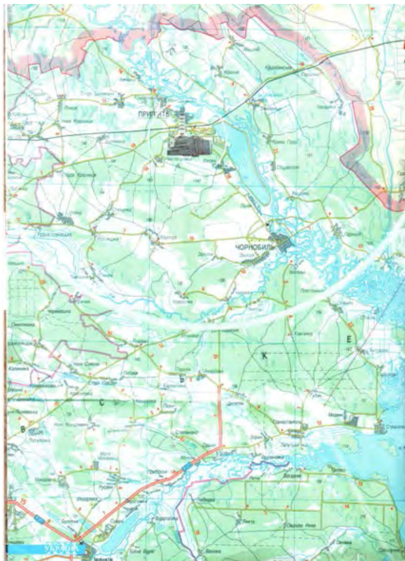
Іл. 1.5. Тридцятикілометрова зона відчуження

зони відчуження та ЧАЕС проводяться екскурсії для туристів. Проте більшість евакуйованих залишилась жити і працювати за межами рідних домівок.