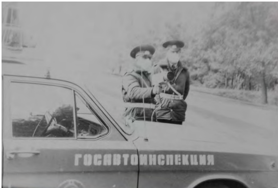
На бойовому посту в с. Термахівка