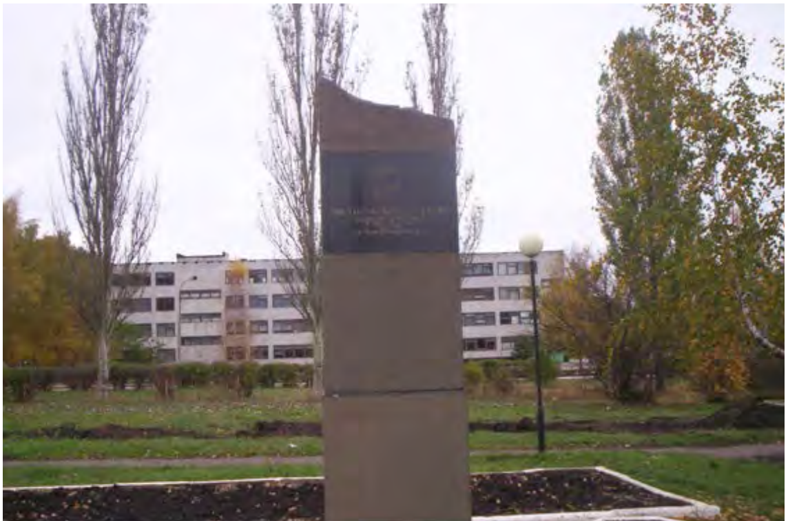
Іл. 1.7. Пам'ятний знак «Загиблим від Чорнобильської катастрофи»