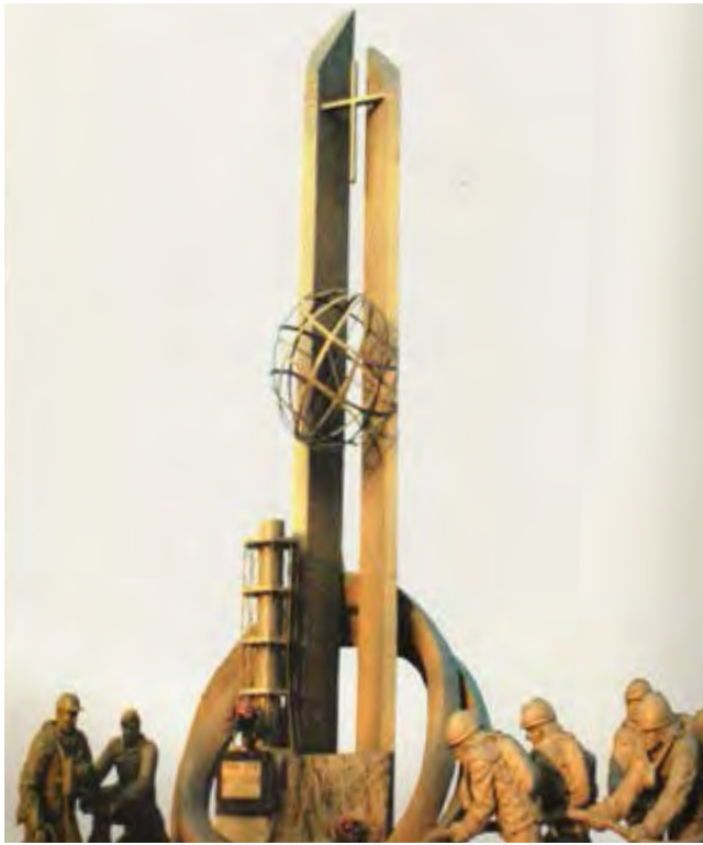
Іл. 1.3. Пам'ятник пожежникам-ліквідаторам поблизу Чорнобильської АЕС