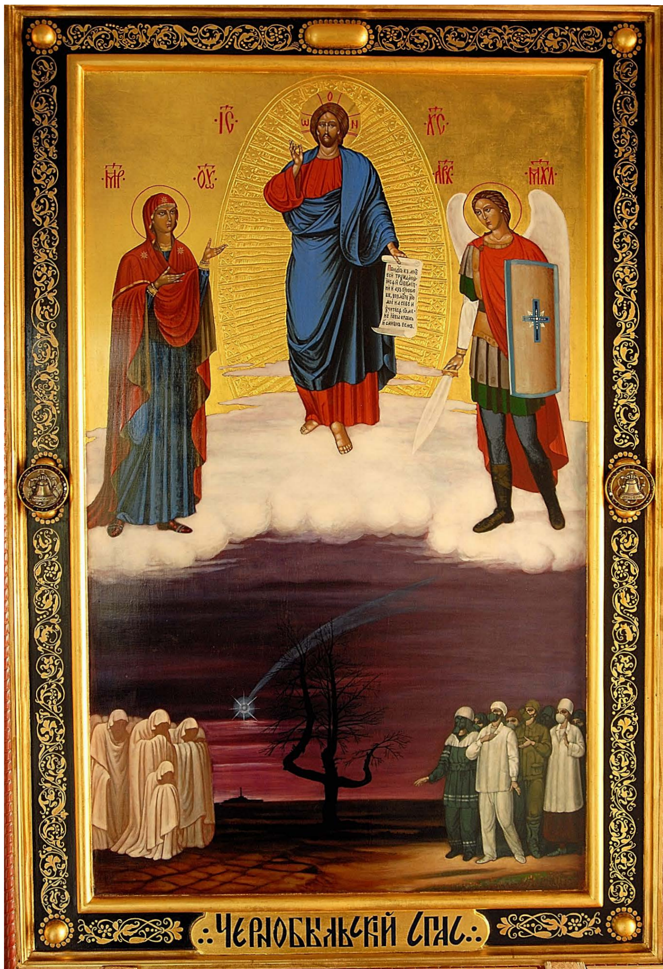
Ил. 1.10. Икона «Чернобыльский Спас».