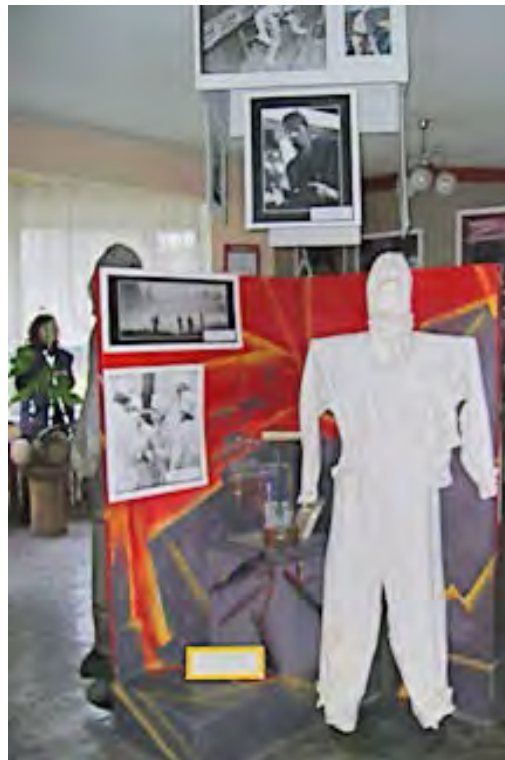
Іл. 1.9. Експозиція в краєзнавчому музеї, присвячена героям-чорнобильцям

26 листопада 2009 року на прохання Святійшого отця Дмитрія та прихожан Свято-Архістратиго-Михайлівського жіночого монастиря ікона «Чорнобильський Спас» була привезена до Лозової. Уважають, що ця ікона зцілює людей, хворих на онкологічні захворювання, які виникли внаслідок дії радіації. Усі охочі лозівчани мали змогу поклонитися цій святині.