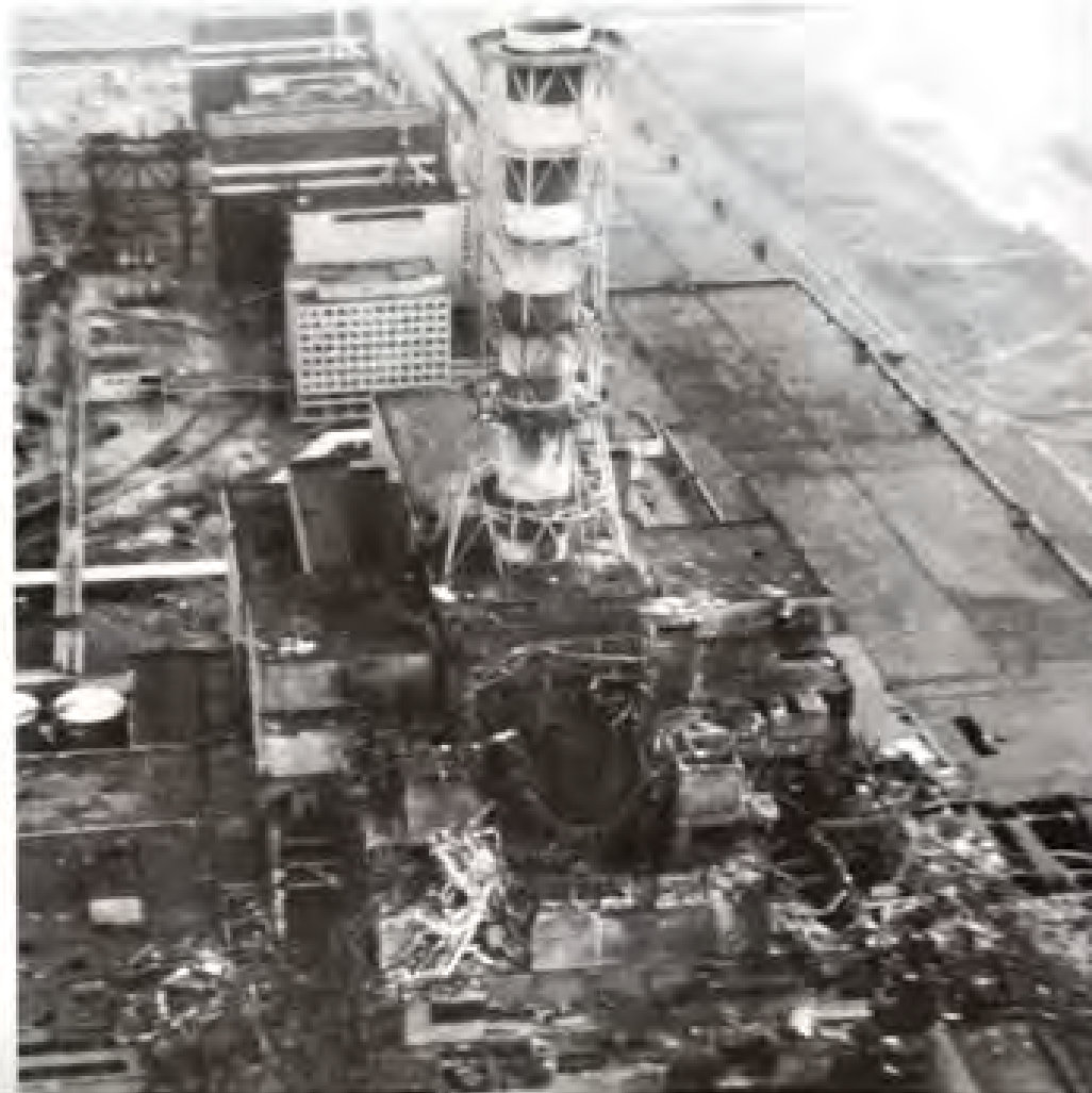
Іл. 1.1. IV енергоблок Чорнобильської АЕС після вибуху

May 1986. The former roof of the fourth power unit. Four months later the "Sarcophagus" will be built here.