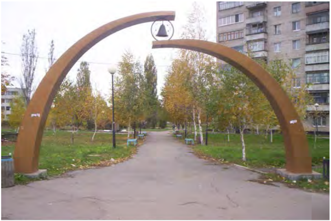
Іл. 1.6. Алея пам'яті чорнобильців