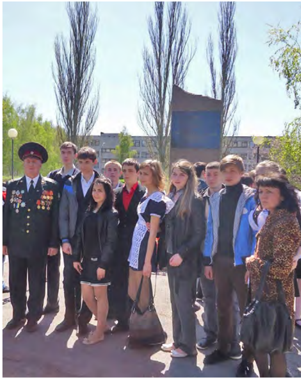
Іл.1.8. Участь вихованців ЛБДЮТ у мітингу-реквіємі «Мужність і біль Чорнобиля»