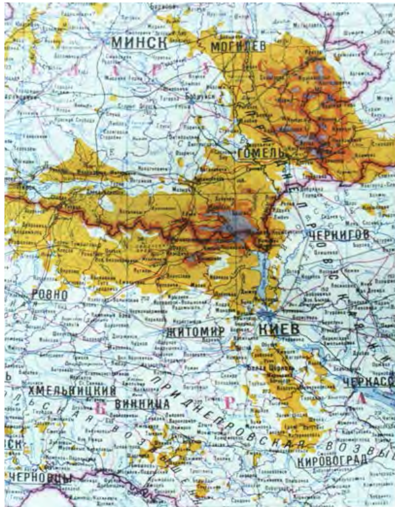
Іл. 1.2. Територія забруднення радіацією

А те, що звучало по радіо й телебаченню, друкували на сторінках газет і журналів, не було правдою. Мовляв, нічого страшного не трапилося, рівень радіації незначною мірою перевищує допустимий, треба трішечки зусиль, і все знову повернеться до нормального стану. Провідні вчені стверджували, що ядерні реактори можна розташовувати навіть біля кремлівських стін. Тому певною мірою стає зрозумілим настрій деяких спеціалістів на початку ліквідаційних робіт, мовляв, «шапками закидаємо».