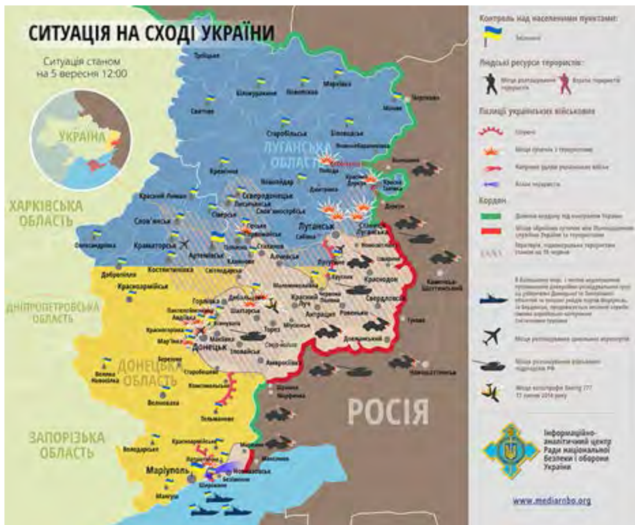
Іл. 2.1. Ситуація військового конфлікту на сході України станом на 17 липня 2014 року

Мабуть, у кожному населеному пункті нашої держави є прямі учасники цієї війни, які виконують не тільки свій обов'язок перед державою, але й свідомо стали в складний для нас час на захист своєї Вітчизни (Іл. 2.1.).